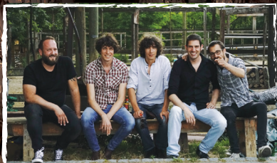
The Long John Brothers