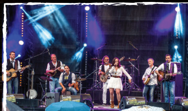
The Lady's Country Angels